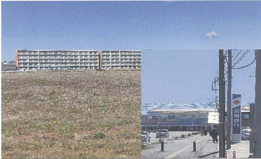
稲吉南20,366㎡市有地に神立病院誘致! 令和9年度開業へ

神立駅西口はじわかに活気がしてきました。神立病院誘致基本協定に、令和9年度開業がうたわれています。神立駅西口本通り(停車場線)へ常陽銀行が移転、開業しました。 働く女性の家が4月コミュニティ(公民館)施設に衣替えます。ショッピングセンターには市の福祉部等の移転準備が進んでいます。又千代田地区コミュニティセンター(公民館)